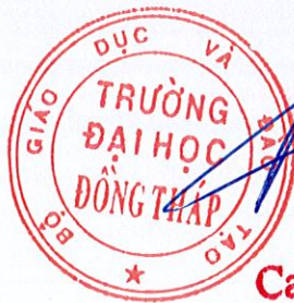
Cao Dao Thép